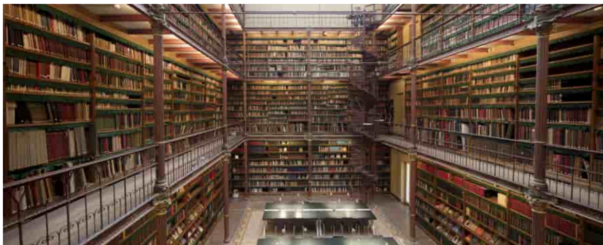
De Cuypersbibliotheek